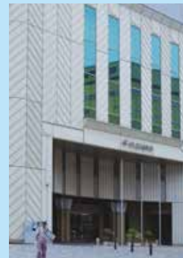
ザ・クレストホテル柏